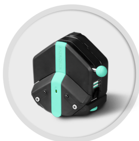
EasyPump-PPS 系列 (不可调压)