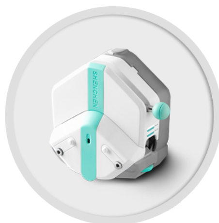
EasyPump 系列 (不可调压)