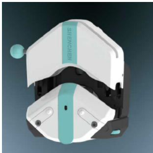
1. 逆时针扳动扳杆180°， 打开压块。