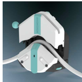
3. 将软管自然放入上压块 和滚轮之间。