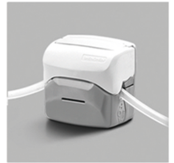
4. 向下合上泵头翻盖，完成软管安装。