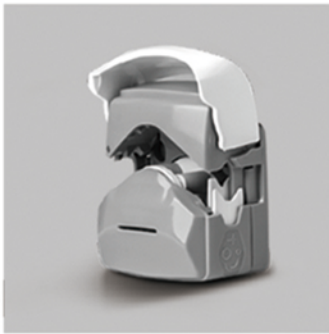
1. 向上掀开泵头翻盖，打开泵头。